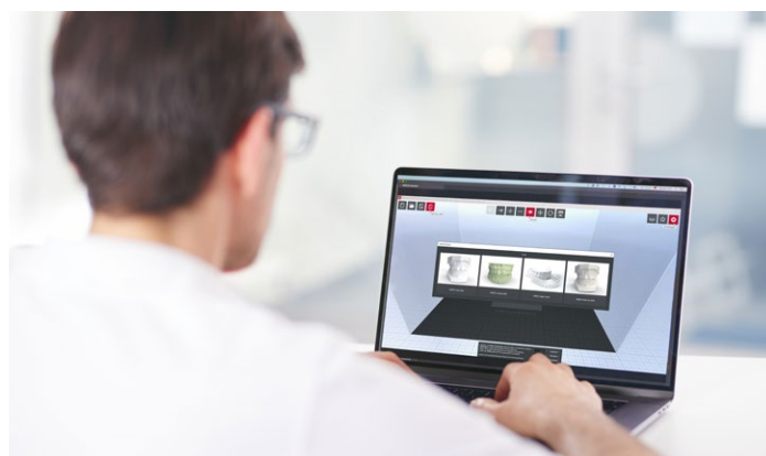
Software de fatiamento SIMPLEX com pré-definições pré-instaladas para a área de Ortodontia