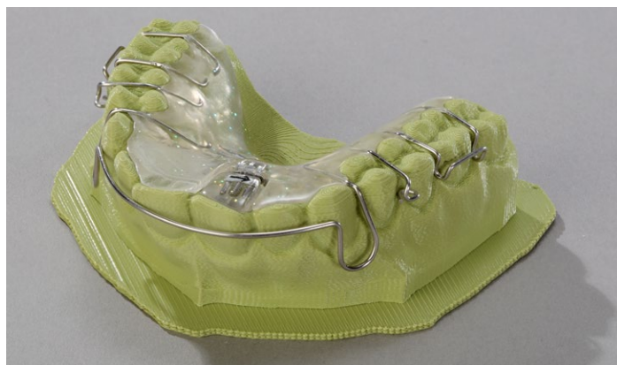
Sem necessidade de qualquer acabamento, é possível prosseguir o trabalho com o modelo como habitualmente