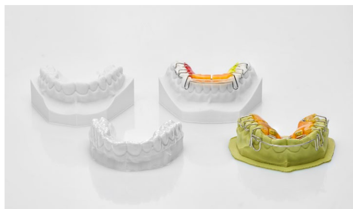
Desenvolvido para toda a confecção de modelos na área de ortodontia