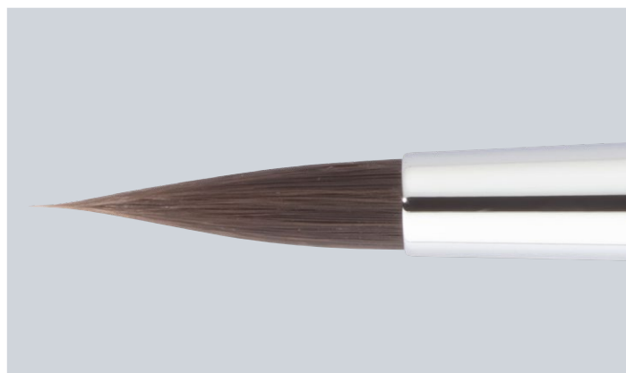
Pinceau en fibre Bionic Hair