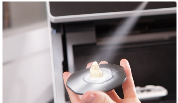
Pulverización homogénea para unas capturas más detalladas