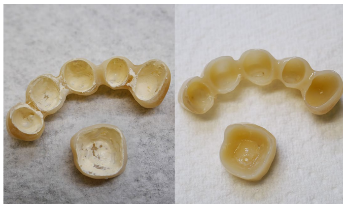
Prótese antes e depois da limpeza