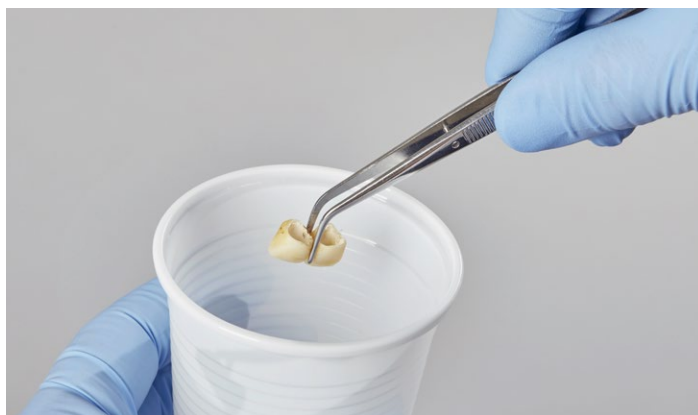
Simplesmente deixar atuar durante 10 minutos ...