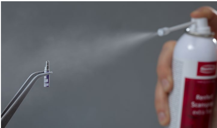
Mikrofeiner Auftrag für ein detailgenaues Scanergebnis